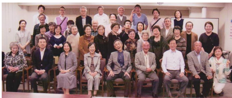
集合写真