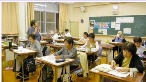
夜間中学の授業風景(映画『こんばんはII』の1シーン)

ウクライナの子どもたちが極限状態で描いた絵を、子どもたちの安全と早期の戦争終結を願って展示し